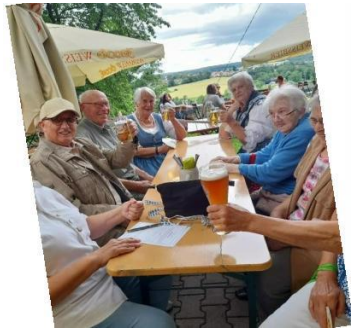
Unsere Volksfestköniginnen 😊

Manche Gäste haben extra für diesen Anlass ihre Trachtenkleidung angezogen und das Wetter spielte auch noch mit.