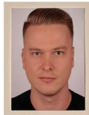
Alfred Großmann Fahrdienst