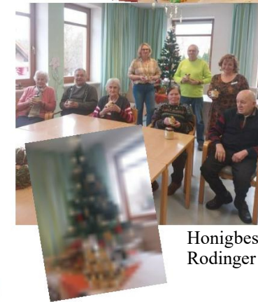
Honigbescherung vom Rodinger Imkerverein