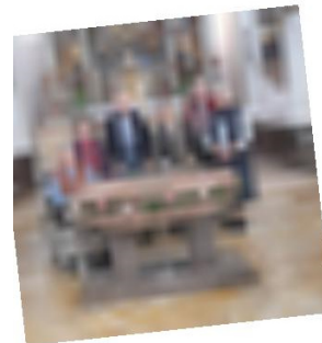
Maiandacht am Heilbrünnl mit anschließendem Biergartenbesuch