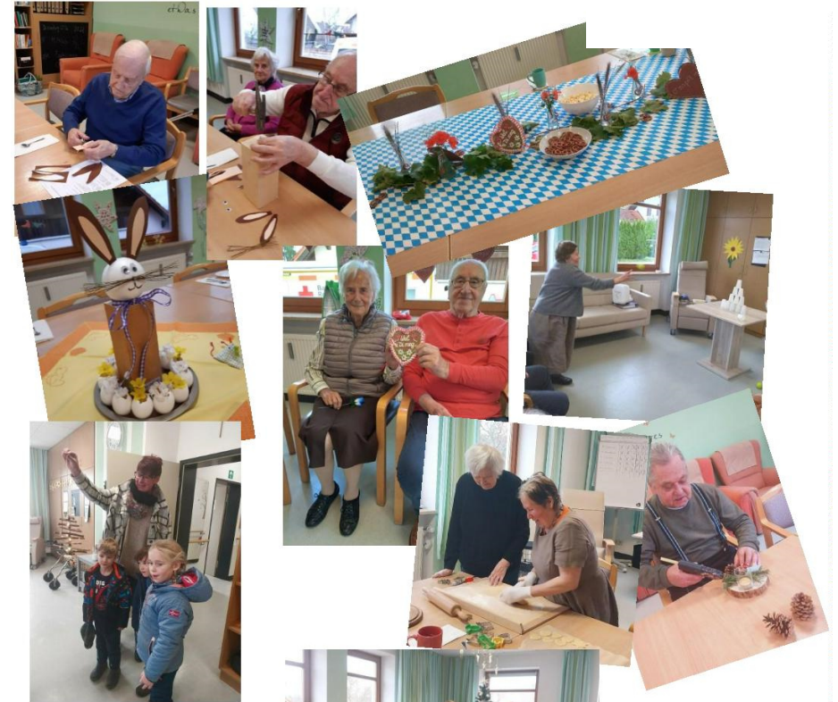
Überraschung von den Rodinger Glückszwergen (BRK-Waldkindergarten Mitterkreith)