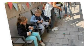
Sportfest mit den Kindern des Thomas Wiser Hauses und Bewohnern der ambulant betreuten Wohngemeinschaft

Zwar wäre jeder froh, wenn es dies nicht geben müsste, trotzdem zählen die von uns organisierten Impfaktionen gegen Corona durchaus zu den Höhepunkten. Wir freuen uns, dass das Angebot so gut angenommen wurde