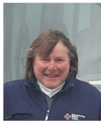
Matthias Bless Fahrdienst