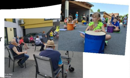
Aktionstag Musik mit der Grundschule Willmering